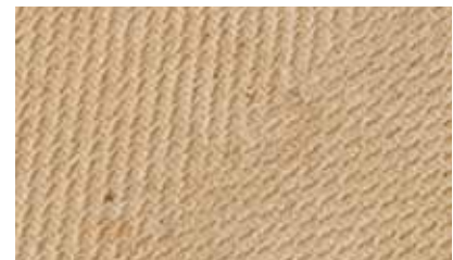
Finish-Oberfläche der STEICO top Dämmplatten

Darüber hinaus sind STEICO top Dämmplatten hoch diffusionsoffen. Sollte doch einmal Feuchtigkeit eindringen, kann sie problemlos verdunsten. Bei anderen Dämmstoffen wirken die - für die Abdeckung - notwendigen Holzwerkstoffplatten wie eine obenliegende Dampfbremse. So reduziert STEICO top deutlich das Risiko von Schimmelbildung.